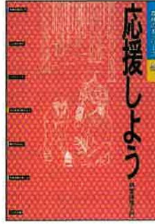
A4判 16頁カラー 定価:本体200円+税

ISBN978-4-88138-101-4 林業の役割や仕事内容をやさしく解説するとともに、林業体験のガイドとなるように育林方法や体験の楽しさを紹介しました。