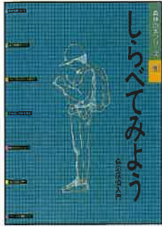
A4判 16頁カラー 定価:本体200円+税

ISBN978-4-88138-100-7 森の探偵となって自分たちで森の生物を調べる方法を分かりやすく紹介。森の樹木や草花、動物、昆虫、きのこなどの楽しい出会いが、森林と親しむきっかけとなります。