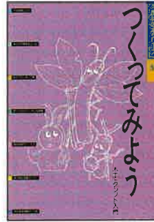
A4判 16頁カラー 定価:本体200円+税

ISBN978-4-88138-103-8 生物材料としての木のしくみや特長をやさしく説明し、木工・クラフトを楽しむアイデアと工夫、道具を紹介しました。枝や葉、廃材、板材を使った作品、オブジェづくり、ミニチュア森の国づくりなど、従来の木工テキストとはひと味違う楽しい内容です。