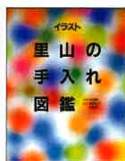
イラスト 里山の手入れ図鑑