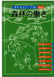
A4判 16頁カラー 定価:本体300円+税

ISBN978-4-88138-185-4 森林の大切な働きを紹介。水をたくわえたり、災害を防いだり、森林の大切な働きを知ろう。