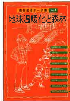
A4判 16頁カラー 定価:本体300円+税

ISBN978-4-88138-187-8 森林は天然の炭素の貯蔵庫です。地球温暖化と森林のはたす役割、炭素を貯めた木材製品の利用など、森を通して地球環境のことを知ろう。