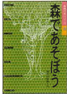
A4判 16頁カラー 定価:本体200円+税

ISBN978-4-88138-102-1 雑木林の成り立ち、しくみをやさしく解説するとともに、雑木林を利用したいろいろな遊びを紹介しました。遊びながら雑木林の手入れになる。そんな楽しさがいっぱい盛り込まれています。