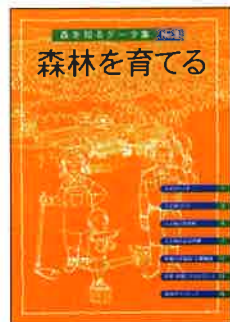
A4判 16頁カラー 定価:本体300円+税

ISBN978-4-88138-186-1 人が植え、育てる人工林をつくり、利用する仕事が林業です。再生可能な資源・森林を育てる夢のある仕事を知ろう。