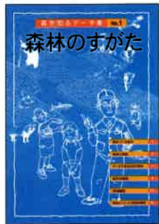
A4判 16頁カラー 定価:本体300円+税

ISBN978-4-88138-184-7 日本では国土の約70%が森林です。森林のしくみ、環境、樹木、生き物など、そのすがたを知ろう。