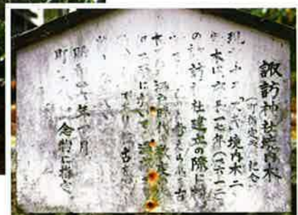
【森林やまがた113号(2008年1月)記載】