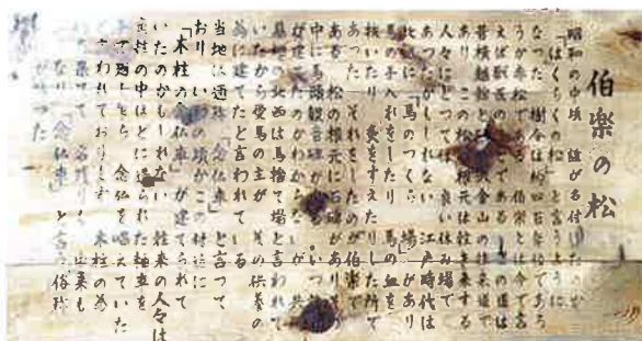
【森林やまがた92号(2004年11月)記載】