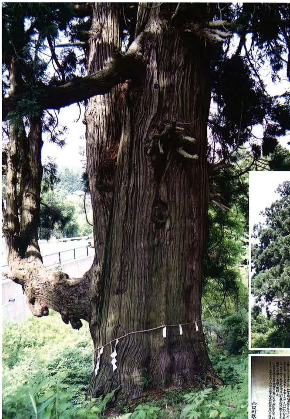
【森林やまがた76号(2003年7月)記載】