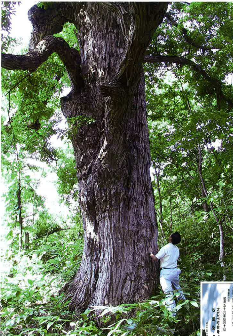
【森林やまがた71号(2003年2月)記載】